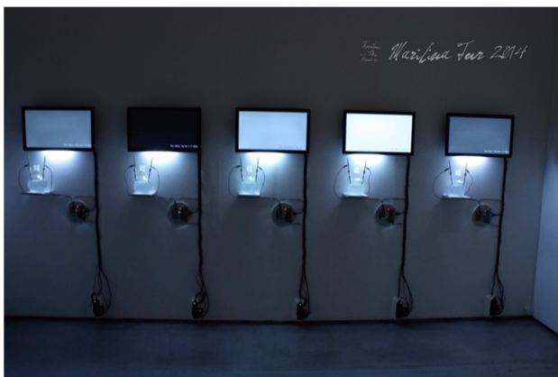
Estudi de salinitat nº4, 2014