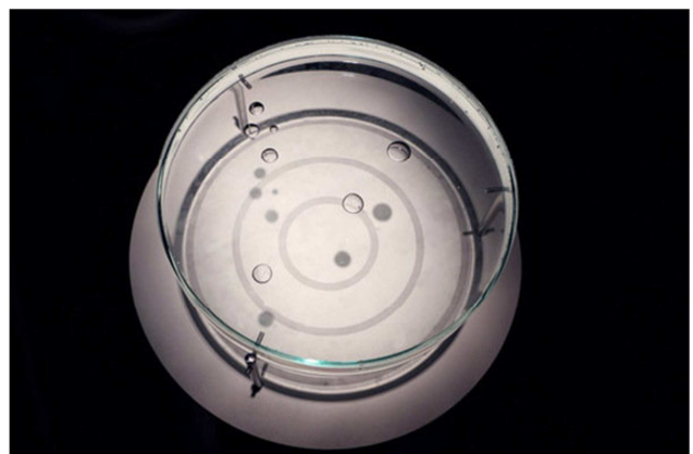
Nivell circular, 2014

Els materials usats i la poètica de que es serveix per a manipular-los determina els objectes resultants. Objectes que, en general, serveixen per mesurar i que ens presenta a l'espai en format instal·lació.